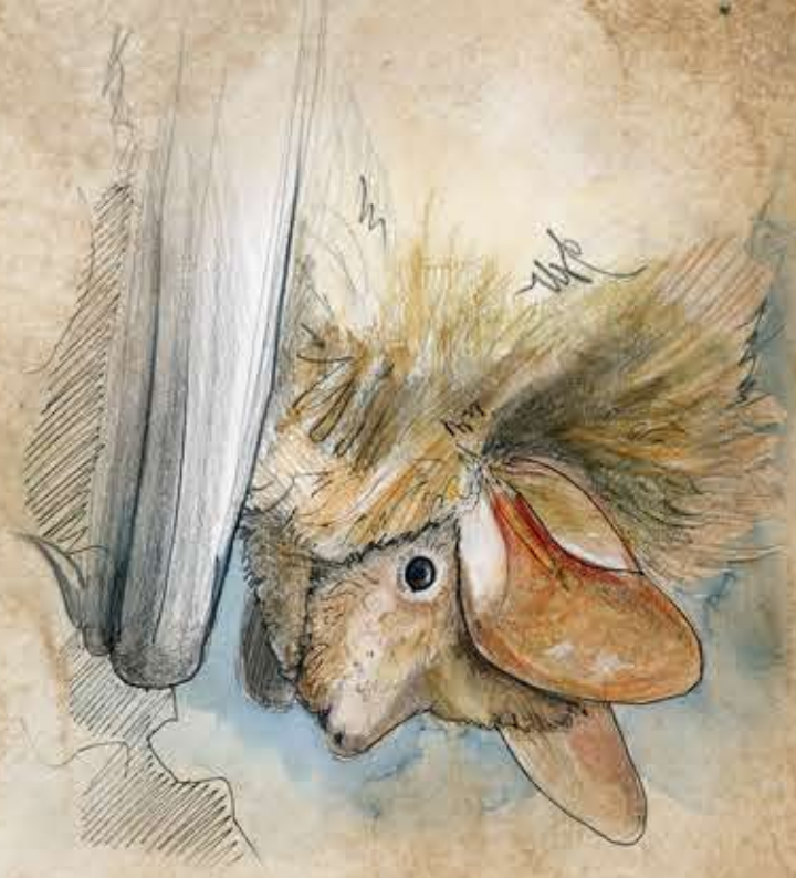
Murin à oreilles échancrées