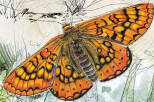
Damier de la succise