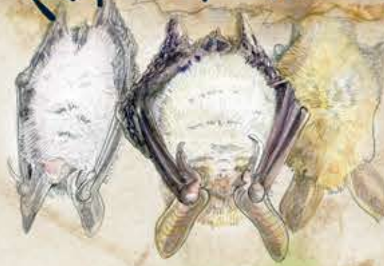
Murin de Bechstein